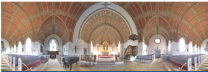
Sankt Clemens kirke, Nykøbing Mors – 360 grader

Ved Sankt Clemens kirke, Nykøbing Mors har vi en stor gruppe frivillige, der bl.a. medvirker ved søndagens højmesse som lægmandslæsere og med forskellige praktiske gøremål ifm. de mange øvrige forskellige arrangementer i løbet af året.