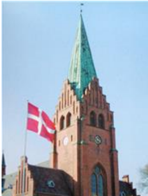
Sankt Clemens Kirke, Nykøbing Mors

Sammenhold, fællesskab og højt til loftet!