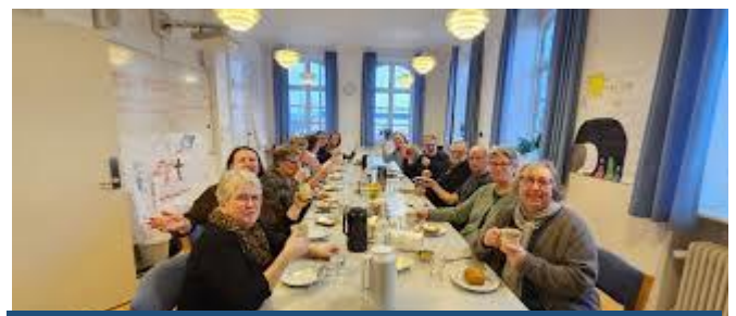
Her har vi det rigtig godt

Tilbagemeldingen er vi stolte af! Vi har et rigtig godt arbejdsmiljø - måske det bedste, som de har undersøgt indtil nu. Det vil vi gerne fortælle mere om.